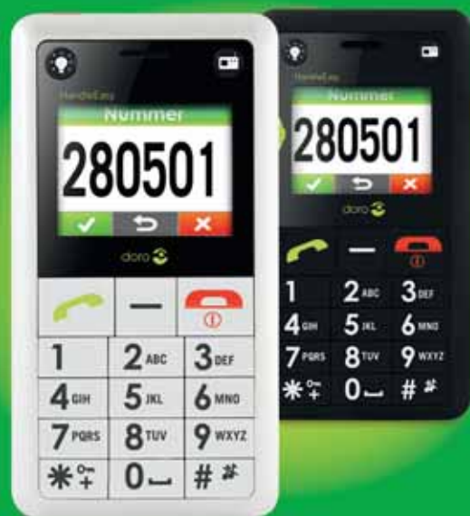
Doro HandleEasy 330gsm