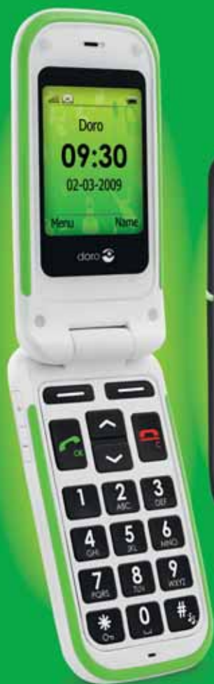
Doro PhoneEasy® 410gsm

Voici la nouvelle gamme de téléphones portables Doro encore plus faciles à utiliser – design élégant conçu pour le confort de ses utilisateurs – vous les aimerez tout simplement.