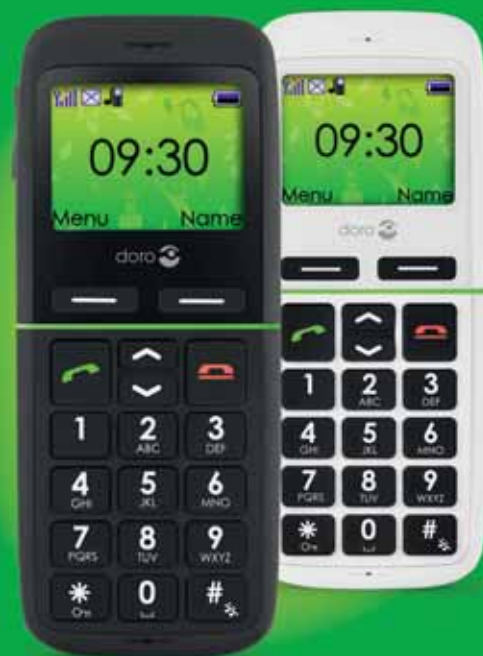
Doro PhoneEasy® 345gsm