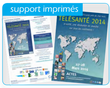
Actes, affichage, presse, dépliant...