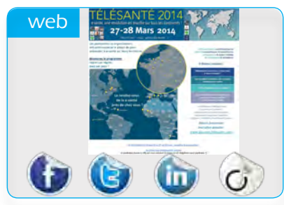
Mailling, newsletter, bannières, réseaux sociaux...