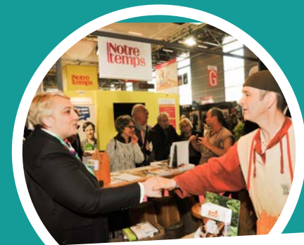
EDITION 2016 : Mme Pascale Boistard, Secrétaire d'Etat en charge des Personnes âgées et de l'Autonomie Stand « Guédelon, ils bâtissent un château fort »