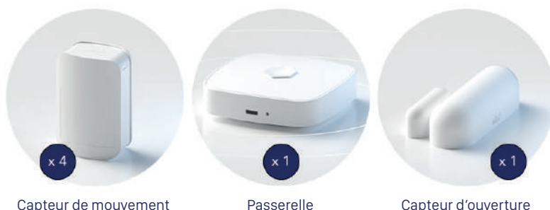
Capteur de mouvement

Afin de se démarquer des solutions de télésurveillance par caméra - invasives et ne permettant pas toujours de détecter une activité inhabituelle, des plateformes de téléassistance professionnels ou des dispositifs de détection de chute plus stigmatisants, OtioCare mise sur des équipements faciles à installer et plus discrets : des capteurs de mouvement et d'ouverture de porte.