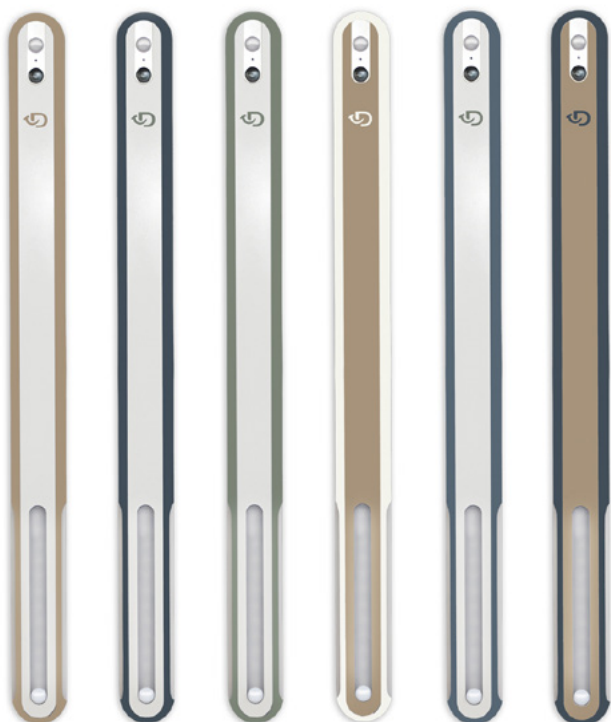
Cappuccino Anthracite Argile Neige Horizon Régilisse